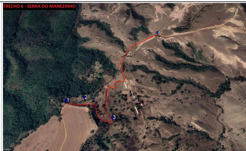
TRECHO 6 - SERRA DO MANEZINHO